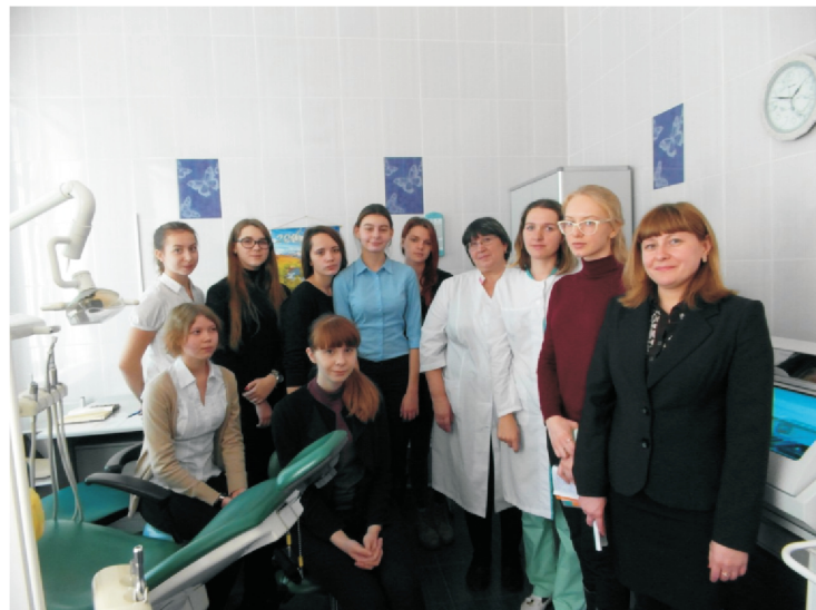
Рис. 1. Экскурсия в стоматологию

Таким образом, посещение стоматологии помогло ребятам больше узнать о своем здоровье и понять, подходит ли им профессия врача-стоматолога. На этом мероприятия, посвященные здоровью, не заканчиваются. В скором времени ученики 10 класса «Е» посетят еще ряд медицинских учреждений, где непременно откроют для себя что-то новое.