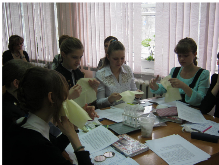
Фото 1. Определяем тип кожи

На нашем уроке мы будем заниматься формированием представления о правилах