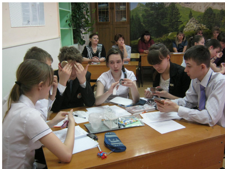
Фото 2. Изучаем правила ухода за кожей

Учитель. Учиться правильно ухаживать за кожей лица следует с малого возраста, не дожидаясь ее увядания и появления морщин. И лучше это делать регулярно, каждый день с использованием домашних косметических средств. Но при этом очень важно знать свой тип