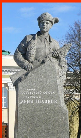
Бюст, г. Москва