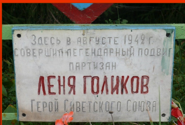
Мемориальная доска подвигу партизана