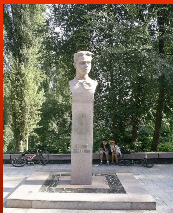
Памятник пионеру Володе Дубинину в г. Днепропетровск