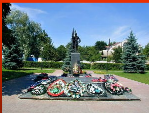
Братская могила в г. Лоев