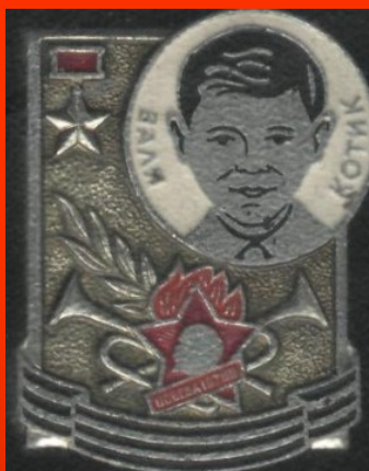
Значок с изображением Вали Котика