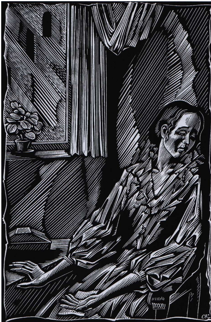
Станислав Косенков. Варенька у окна. Иллюстрация к роману «Бедные люди». 1983

Учитель. Живя в Петербурге, Ф.М.Достоевский внимательно всматривался в окружающий его мир. Столица предстала перед ним со всеми контрастами. Многие ему показались страшным и непонятным. «...Петербург, не знаю почему, — писал он, — для меня всегда казался какою-то тайною». В эту тайну ему хотелось проникнуть, понять, как и чем живут люди в громадном городе и в первую очередь обитатели нищих кварталов. Исключительный успех Достоевскому принёс первый «социальный роман» «Бедные люди», появившийся в печати в 1846 году, когда автор только что окончил Главное инженерное училище и решил посвятить себя литературе. Над этим произведением писатель работал почти год. По совету приятеля Д.В.Григоревича он познакомил со своим произведением Н.А.Некрасова, потом В.Г.Белинского. Прочитав роман, критик